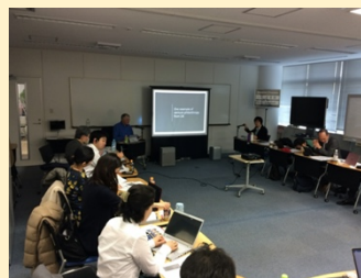
ワークショップ会場